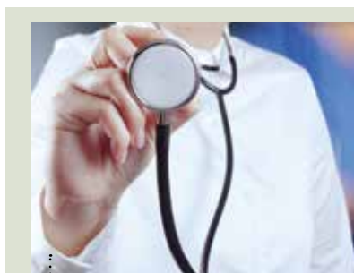
Επαναλειτουργία του Πολυϊατρείου του Συλλόγου Προσωπικού Σελ. 2