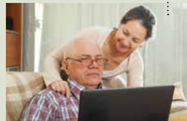
Ηλεκτρονικά οι αιτήσεις για σύνταξη από ΙΚΑ Σελ. 5

Το νέο ΔΣ του Συλλόγου ευχαριστεί όλους τους Συναδέλφους για την συμμετοχή τους στις εκλογές του Συλλόγου μας και για την εμπιστοσύνη τους στα πρόσωπα που εκλέχτηκαν. Ο Πρόεδρος και τα μέλη του ΔΣ εύχονται σε όλους ΚΑΛΟ ΚΑΛΟΚΑΙΡΙ με υγεία, προσωπική και οικογενειακή!