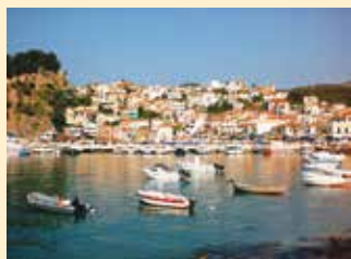
Αποψη από την Πρέβεζα

Πραγματοποιήθηκε με μεγάλη επιτυχία και με την συμμετοχή σημαντικού αριθμού συναδέλφων η τριήμερη εκδρομή στην Πρέβεζα. Οι καιρικές συνθήκες ήταν άριστες, και η οργάνωση και εξέλιξη της εκδρομής άψογη.