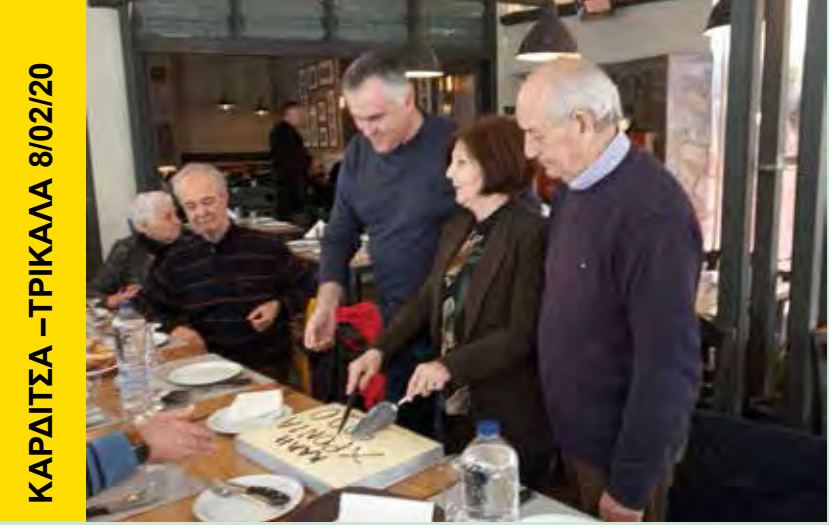
ΚΑΡΔΙΤΣΑ - ΤΡΙΚΑΛΑ 8/02/20